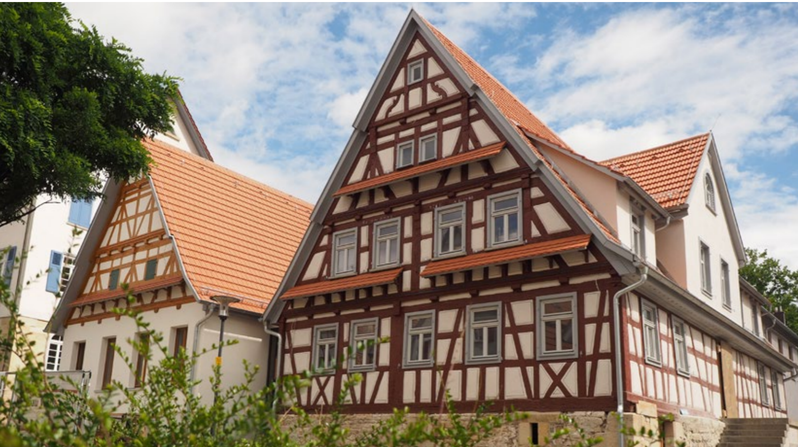
Ausgezeichnete Küche und einzigartige Gästezimmer.

Die Gaststätte „Schwanen“ gehört zu den ältesten Häusern in der Gemeinde Nehren und hat eine lange Tradition. Die Namen der Wirte und Pächter sind bis in das 17. Jahrhundert bekannt. Im Jahr 1992 wurde das Lokal, mittlerweile im Besitz der Gemeinde, aufwendig saniert, um die Gebäudesubstanz zu erhalten. Dem Gemeinderat ging es damals nicht primär um die Rentabilität. Von der Behörde wurde die Konzession für das Wirtshaus in Frage gestellt, da die Kucheneinrichtung nicht mehr dem Standard entsprach. Die Pächter wechselten danach recht häufig, die Wohnbedingungen wurden zuletzt unerträglich. Jahrelang stand das Gebäude leer und wurde baufällig.