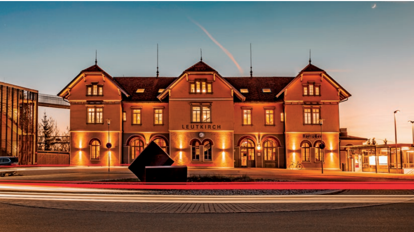
Die Gaststätte ist eine gelungene Mischung aus traditionell und modern.

Das 1889 errichtete Bahnhofsgebäude der Allgäu-Bahn spiegelt die goldene Periode des Eisenbahnbaus Ende des 19. Jahrhunderts wider. Mit seinen hohen Räumen, den Gussäulen, Stuckdecken und Holzvertäfelungen steht dieses historische Gebäude seit 1979 unter Denkmalschutz. Mitte der 80er Jahre ließ die Deutsche Bundesbahn auf Druck der BürgerInnen die Außenfassaden renovieren, der Innenraum blieb weiterhin in einem schlechten Zustand. 1998 musste die Stadt den nicht mehr benötigten historischen Bahnhof für € 230.000 von der Bahn AG übernehmen, wusste aber nicht viel mit der Immobilie anzufangen.