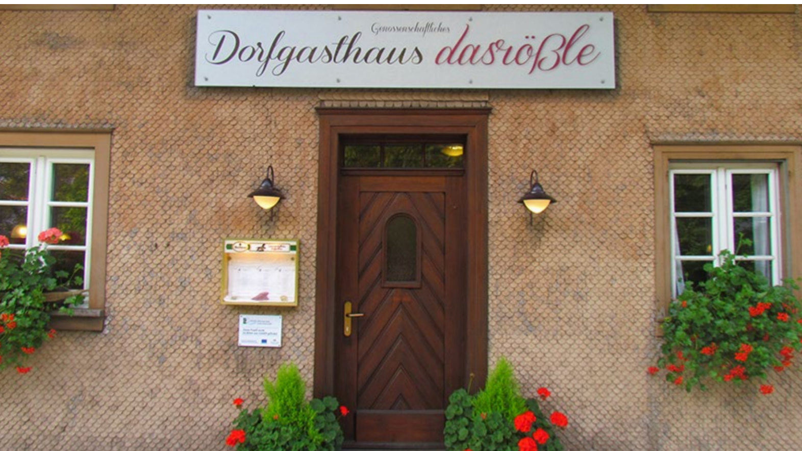
Kultur. Kunst. Denkmal. Soziales.

Im Januar 2012 kaufte die Genossenschaft das 230 Jahre alte Gebäude. Das Haus wurde von rund 40 freiwilligen Helfern komplett ausgeräumt. Im Oktober 2012 starteten die Sanierungsarbeiten. Teile der Fassade wurden entfernt, ebenso Wände und Decken. Da die Genossenschaft ohnedies auf die Genehmigung der EU-Fördergelder warten mußte und davor keine Gewerke vergeben durfte, wurde zwischenzeitlich der Maßnahmenkatalog für das Baudenkmal mit den zuständigen Behörden abgestimmt.