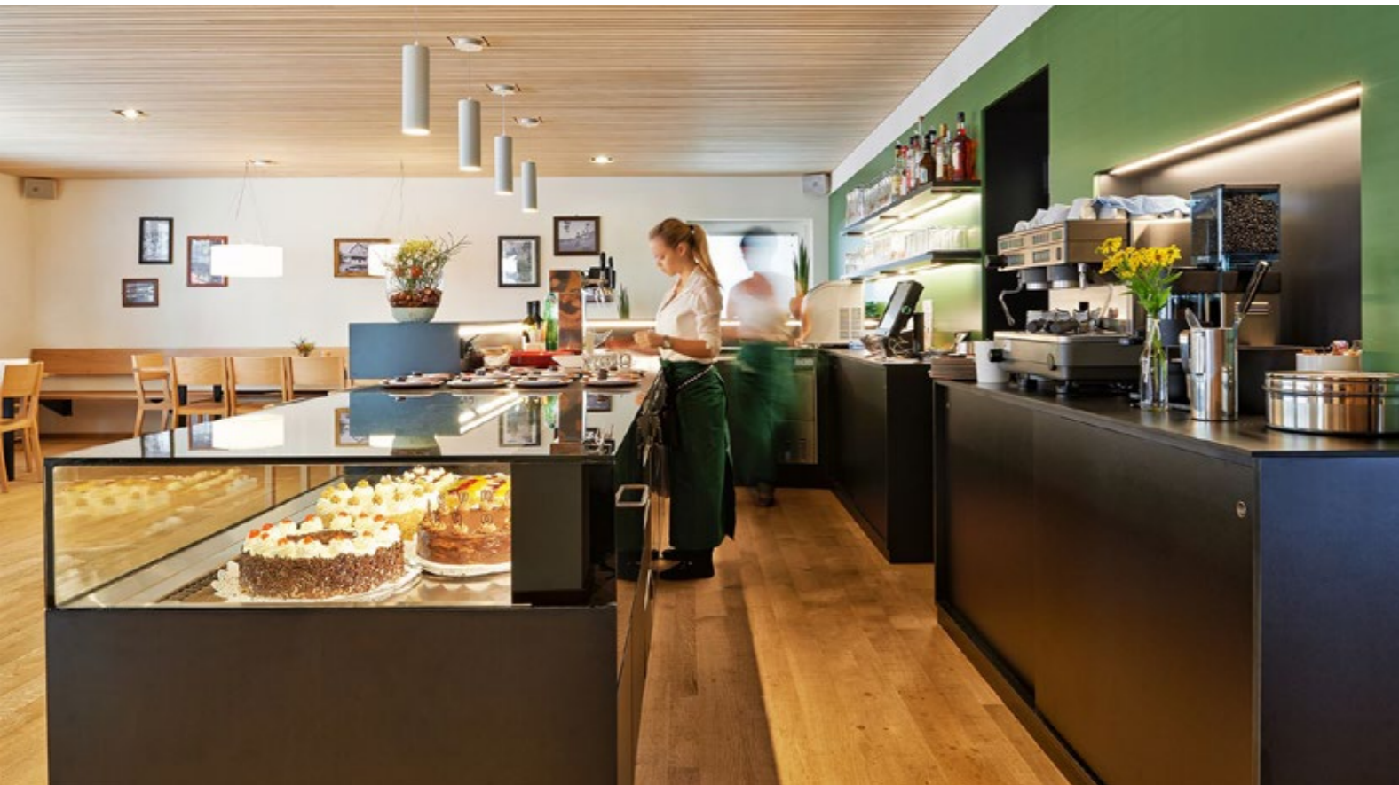
Das Bartle ist ein idealer Rahmen für Ausflüge, Familienfeiern, Besprechungen oder einen gemütlichen Hock.

Ursprünglich befand sich am Standort Dorf 60 in Riefensberg die Vereinessnerei. Im Jahr 1968 übersiedelte diese an ihren neuen Standort. Das alte Gebäude wurde an die Familie Grabherr verkauft, die es zum Café Grabherr umfunktionierte. Bis 2011 hatte das Café Grabherr regelmäßig geöffnet.