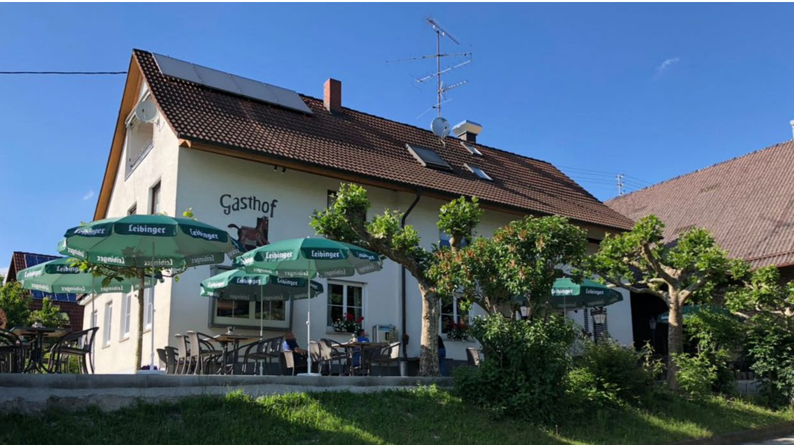
Gutbürgerliche Küche und Spezialitäten.