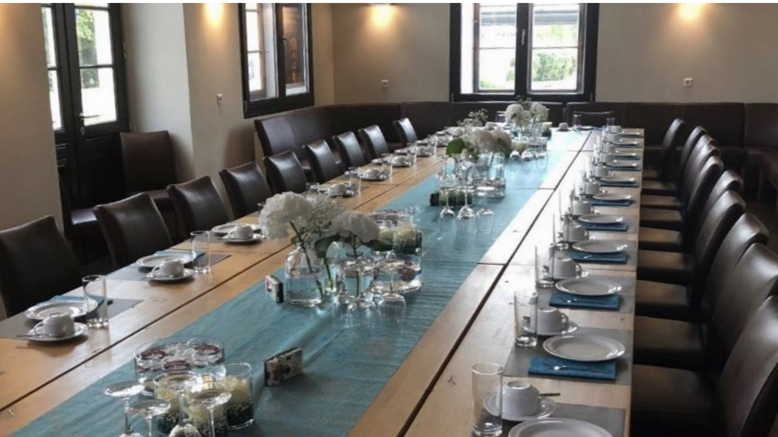
Veranstaltungsräumlichkeiten mit Bedarfsgastronomie und Vinothek.

Im Jahr 2005 erwarb die Gemeinde das 1878 errichtete Gebäude von der Deutschen Bahn. Man suchte viele Jahre nach einer sinnvollen Nutzung, doch die erforderlichen Investitionen erschienen zu hoch. In dieser Situation fanden sich einige BürgerInnen in einem Initiativkreis zusammen. Sie entwickelten gemeinsam mit dem Gewerbeverein und der Bank ein Nutzungskonzept und stellten eine Kalkulation für die Sanierung auf.