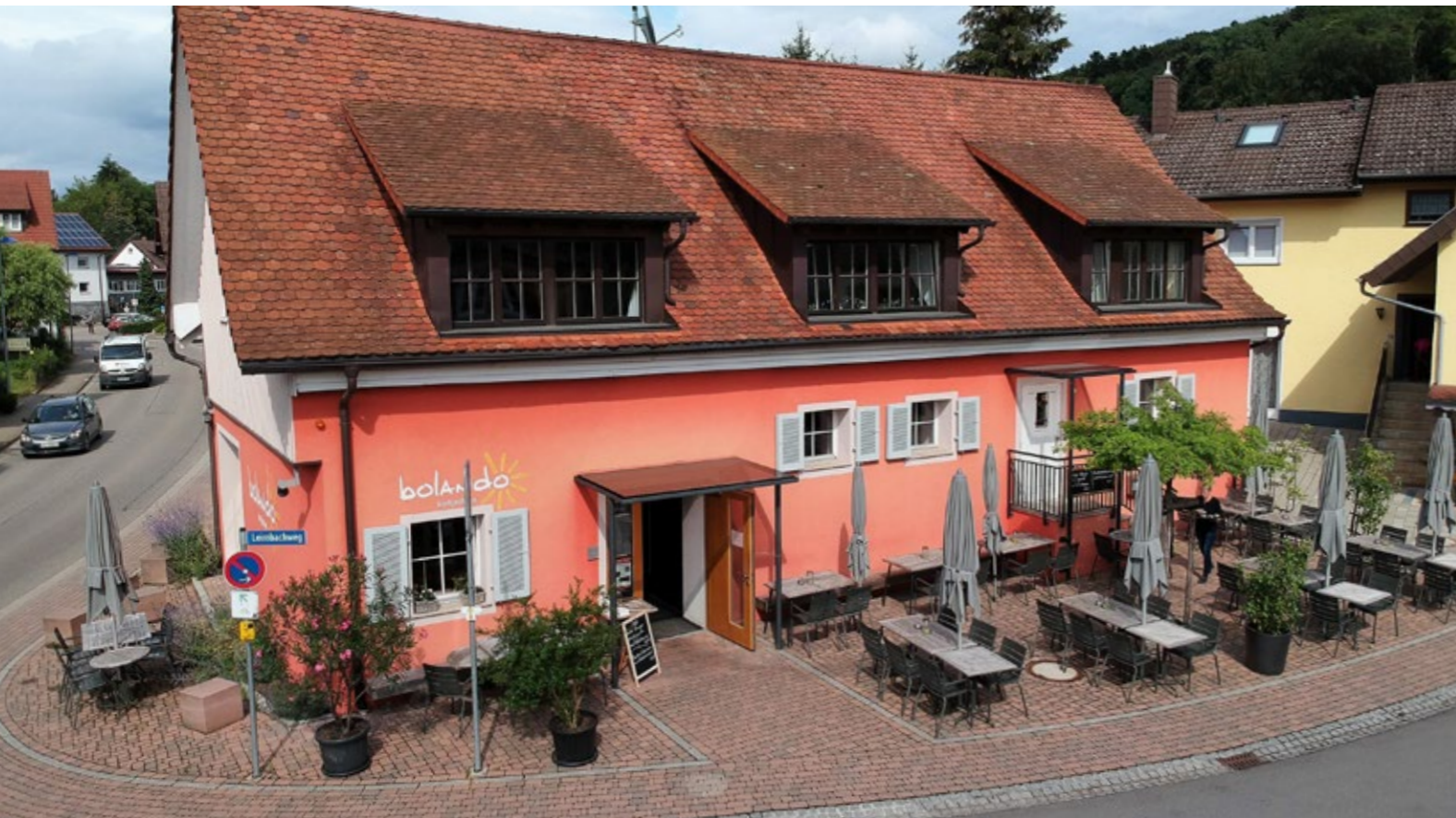
Die wunderbare Lage von Bollschweil zwischen Weinbergen, Rheintal und Schwarzwald ist ein idyllisches Fleckchen Erde zum Wandern, Reiten, Radfahren und das Leben genießen.

bolando ist das erste genossenschaftlich geführte Dorfgasthaus Deutschlands. Die BürgerInnen in Bollschweil nahmen mit diesem Projekt die Gestaltung ihres Lebensraumes selbst in die Hand. Sie gründeten 2006 eine Genossenschaft mit dem Ziel, ein Gasthaus in Bollschweil in Eigenbetrieb zu eröffnen. In der Folge zeichneten mehr als 240 Personen Genossenschaftsanteile. Mit diesem Geld und viel Eigenleistung gelang es, das vom Abriss bedrohte Bauernhaus zu renovieren und auf den aktuellen technischen Stand zu bringen. Im Jahre 2010 wurde das Dorfgasthaus bolando eröffnet.